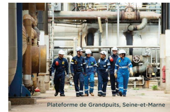
Plateforme de Grandpuits, Seine-et-Marne

Engagée dans l'Alliance européenne pour l'hydrogène propre, notre Compagnie développe à La Mède (Bouches-du-Rhône) le plus grand site de production d'hydrogène renouvelable de France en partenariat avec ENGIE. Le futur électrolyseur, d'une capacité de production de 5 tonnes d'hydrogène vert par jour, marque un jalon important dans la construction d'une filière hydrogène en France.