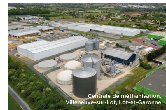
Centrale de méthanisation, Villeneuve-sur-Lot, Lot-et-Garonne

Avec la reconversion industrielle de la raffinerie de Grandpuits en une plateforme zéro pétrole, TotalEnergies se tourne vers des énergies d'avenir dans le domaine de la biomasse avec la production de bioplastiques et de biocarburants essentiellement destinés au secteur aérien.