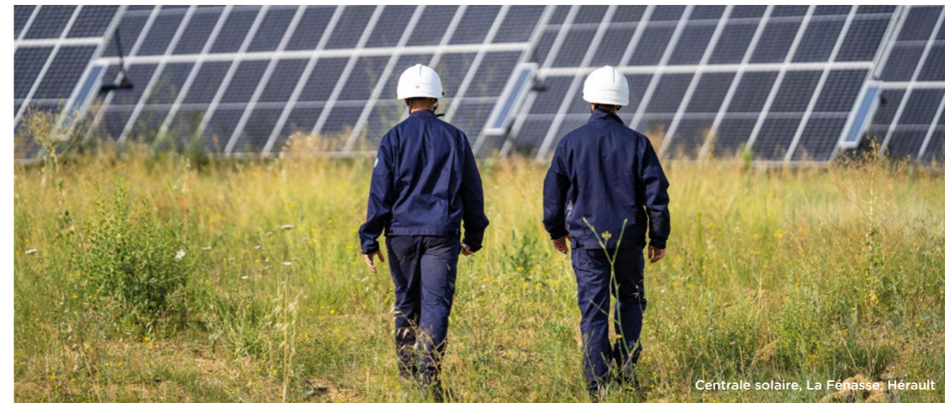
Centrale solaire, La Fénasse, Hérault

TotalEnergies investit dans l'énergie solaire, éolienne et hydraulique. Notre objectif est de produire 4 gigawatts (GW) d'ici 2025 en France. De la solarisation de sites tertiaires aux grands contrats d'achat, notre palette de solutions d'électricité verte fait de notre Compagnie un partenaire de choix pour les entreprises engagées dans la transition énergétique. La croissance de notre capacité de production d'électricité renouvelable est portée par notre engagement dans la filière de l'éolien marin, comme en témoigne notre participation à l'appel d'offres en vue de développer un parc éolien flottant au large des côtes sud de la Bretagne.