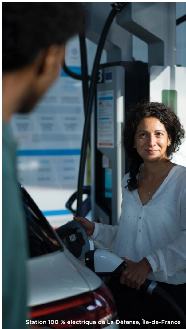
Station 100 % électrique de La Défense, Île-de-France

Biocarburants, gaz et biogaz, recharge électrique, ou encore hydrogène, notre ambition est de rendre la mobilité plus durable en développant des solutions concrètes autour des nouvelles énergies. En Europe, et en France en particulier, nos ambitions répondent aux attentes fortes de la société.