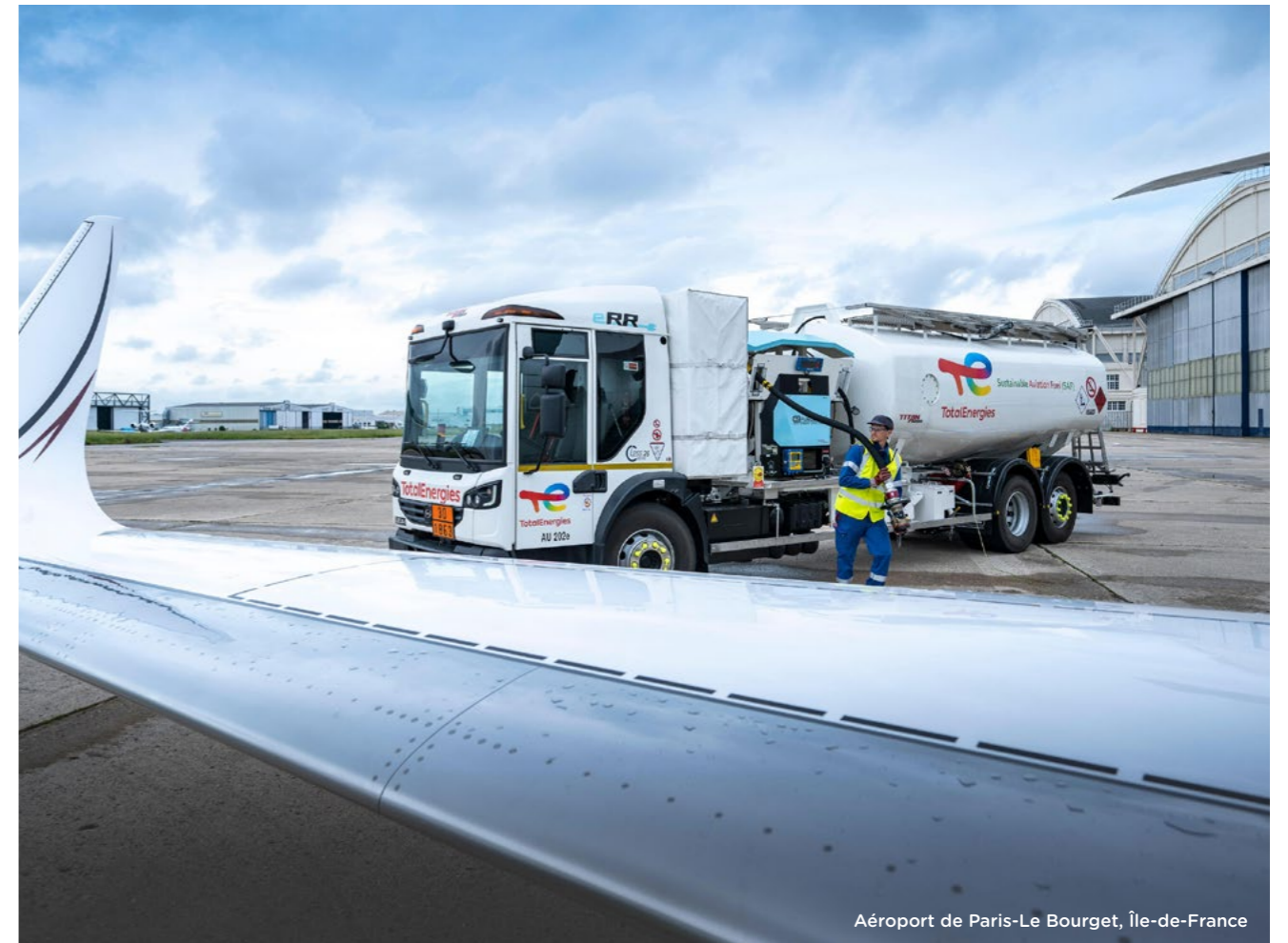
Aéroport de Paris-Le Bourget, Île-de-France

L'hydrogène joue un rôle clé dans la démarche de décarbonation de la mobilité engagée par TotalEnergies, tout particulièrement dans le transport routier longue distance. Sur ce sujet, nous travaillons aux côtés de Daimler Truck au développement d'infrastructures pour les poids lourds roulant à l'hydrogène, avec un objectif : exploiter, d'ici à 2030, jusqu'à 150 stations hydrogène dans différents pays européens, dont la France. Nous misons également sur cette énergie « zéro émission » pour la mobilité urbaine via notre entrée dans le capital d'Hysetco, société française qui opère des infrastructures de recharge d'hydrogène à Paris destinées, entre autres, à la plus grande flotte de taxis hydrogène zéro émission au monde.